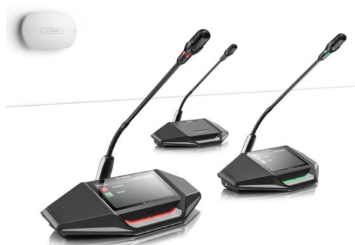
Micro de conférence HF