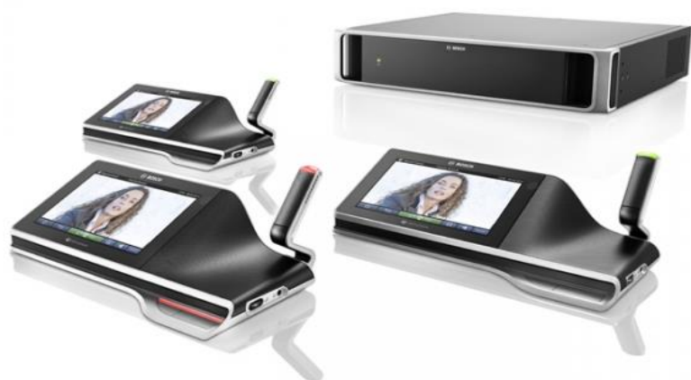
Micro de conférence multimédia