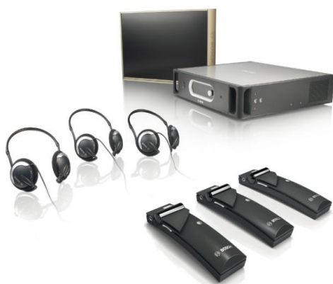
Récepteur IR numérique