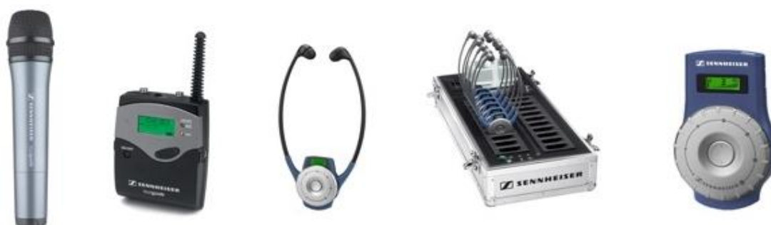
Système d'interprétation portable « Bidule »