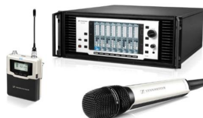
Micro HF numérique D9000